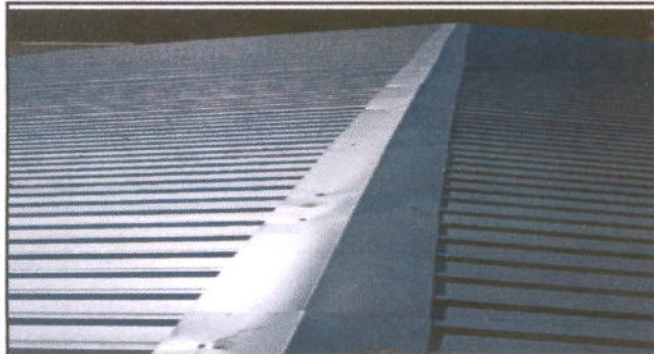
Foto1: MÓDULO 1 AULAS CUBIERTA DE LÁMINA: Sustitución de lámina, por lámina troquelada aluzinc calibre 26, Sustitución de capote de lámina para lámina troquelada