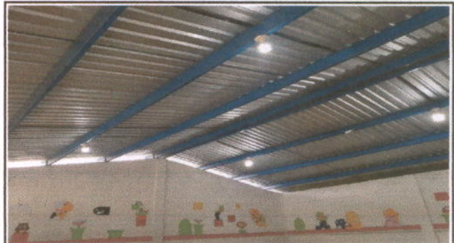
Foto 2: MÓDULO 1 AULAS ESTRUCTURA DE TECHO: Sustitución de estructura de soporte de metal, por metal, REPARACIÓN DE SISTEMA ELÉCTRICO: Sustitución de lamparas tipo LED,