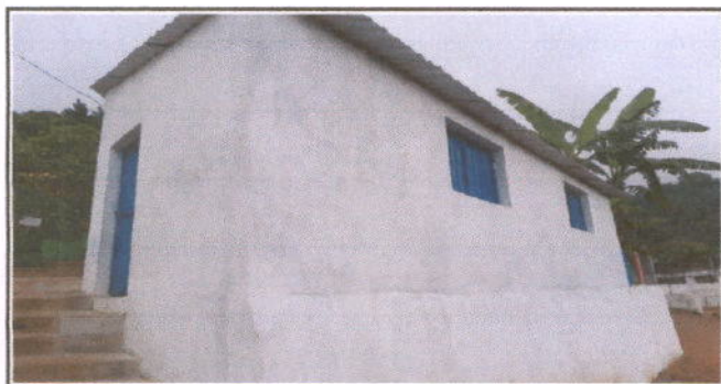
Foto 5: MÓDULO 3 COCINA Sustitución de muro de lámina por muro de block