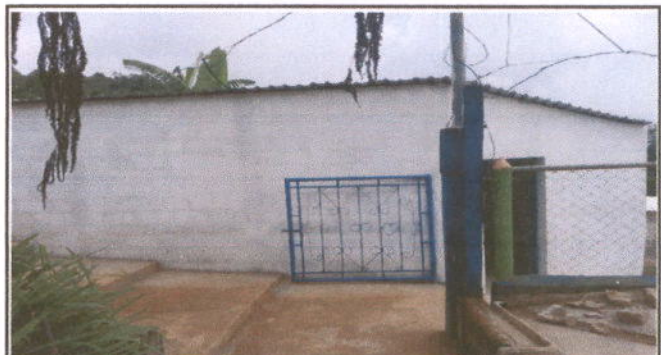
Foto 4: MÓDULO 3 COCINA CUBIERTA DE LÁMINA: Sustitución de lámina, por lámina troquelada aluzinc calibre 26, ESTRUCTURA DE TECHO: Mantenimiento a estructura de soporte de metal